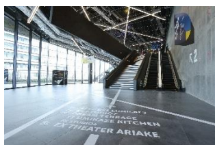
2階エントランス内部