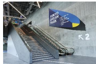
2階エントランス内部