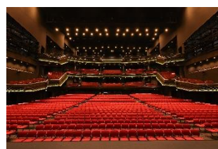
SGC HALL ARIAKE