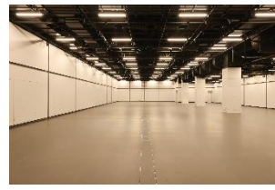
EX STUDIO 7