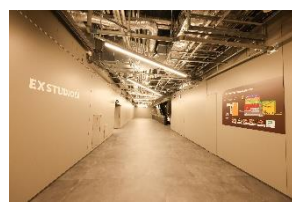
EX STUDIO 7