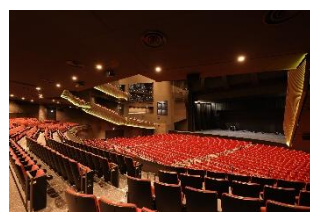
SGC HALL ARIAKE