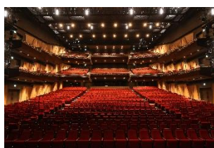
EX THEATER ARIAKE