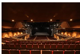
EX THEATER ARIAKE